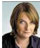
Analyse Von Gabriele Starck

Der Hochschuldialog ist gescheitert. Erstaunlich ist das aber gar nicht, da grundlegende Fragestellungen im Gespräch ausgespart blieben.