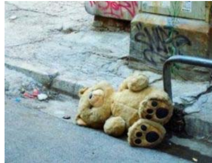
Ohne Therapie entkommen psychisch kranke Kinder kaum der Armutsspirale

heute, Donnerstag, im Rahmen einer Pressekonferenz aufmerksam gemacht.